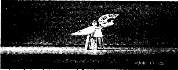
그림2. 우측 하부 30°, 좌측 상부 45° 효과: 입체적인 효과를 나타내며 무용수를 슬림해 보이고 길어보이게 한다.