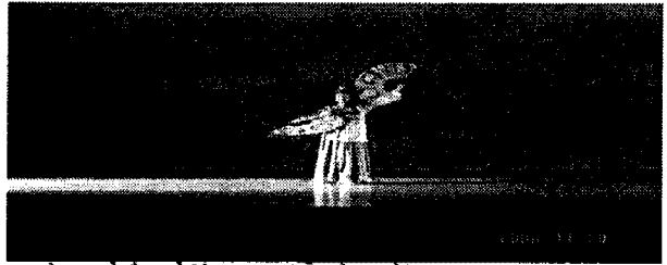
그림4. 좌우 상부 30° (측면조명) 효과: 측면조명을 이용하여 얼굴과 신체를 윤곽있게 드러내준다.