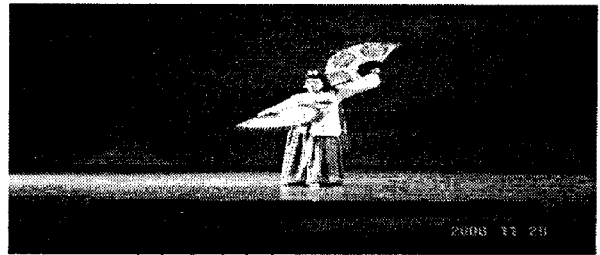
그림 7. 조명과 측면라이트 조명 효과: 90° 스포트라이트로 머리를 눌러주어 무용수의 신체가 눌러보이나 좌우 타워라이트 조명으로 입체감을 주어 슬림해보인다.