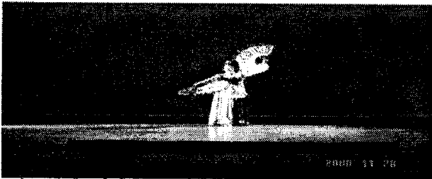
그림1. 우측 상부 45°, 좌측 하부 30° 효과: 입체적인 효과를 나타내며 무용수를 슬림해보이고 길어보이게 한다.