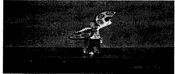
그림 5. 우측 하부 30°조명교차 효과: 얼굴과 신체를 입체적으로 나타내준다.