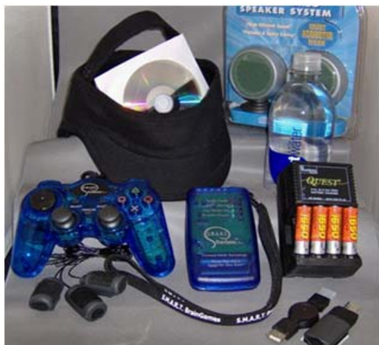
그림 2 Smart Brain System의 톨 셋

먼저 플레이어 캐릭터의 능력이 변하는 경우, BCI를 통해 전달되는 뇌파 정보 중 플레이어가 현재 집중하고 있는 정도를 플레이어의 선택 수단으로 사용할 수 있다. 레이싱 게임의 경우, 집중 정도가 플레이어가 운전하는 자동차의 속도에 영향을 주어, 보다 집중할수록 자동차의 속도가 높아지게 할 수 있다. 실제로 이는 그림 2와 같은 'Smart Brain Games'라고 하는 콘솔 기기용 톨 셋에서 사용하고 있다. 그러나 이 톨 셋은 기존에 출시된 게임을 플레이 할 때, 입력 장치의 버튼 중 일부를 대체하고 있을 뿐이다.[8]