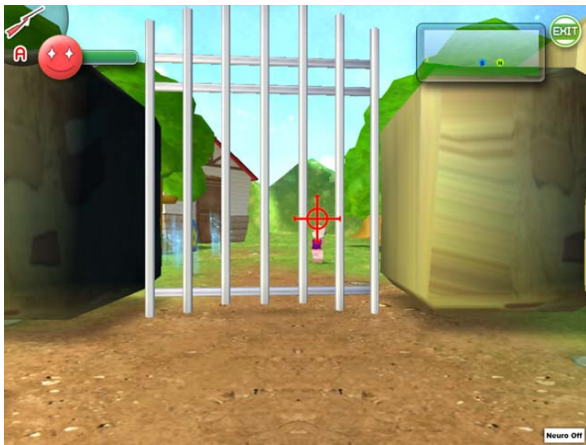
그림 4 조준 중인 화면. 크로스 헤어의 흔들림이 줄어든다.

먼저 ‘조준’ 에서는 플레이어의 집중력에 따라 물체를 조준하는 크로스 헤어의 흔들리는 정도가 변화하며, 집중을 할수록 크로스 헤어의 흔들림이 줄어들어 맞추기가 쉬워진다. ‘탐색’ 은 화면 위에 숨겨져 있는 물건을 찾는 것으로, 플레이어의 집중이나 명상 정도에 따라 화면 상에 보이지 않던 오브젝트가 보이기도 한다. ‘휴식’ 의 경우는 플레이어의 명상 정도에 따라 플레이어 캐릭터의 체력 회복 속도가 빨라지거나 플레이어 주위의 시들어있는 꽃이나 나무들이 활짝 피어나게 된다.