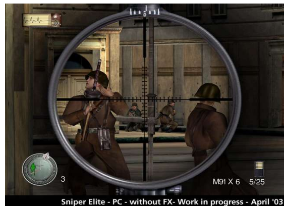
그림 3 'Sniper Elite' 게임 이미지

게임 도중 저격을 해야 할 경우, 조준 시, 보다 집중할수록 타격을 향한 크로스 헤어의 흔들림이 줄어들어 사격이 성공할 확률이 높아지는 것과 같은 식으로 사용할 수 있을 것이다. 이외에도 RPG(Role Playing Games)나 액션 장르의 게임에서는 특정 감정(집중이나 명상 등)이 캐릭터가 사용하는 기술의 성공률이나 실패율, 상태 이상에서의 회복 정도 등에 영향을 주는 방법으로 사용할 수 있을 것이다.