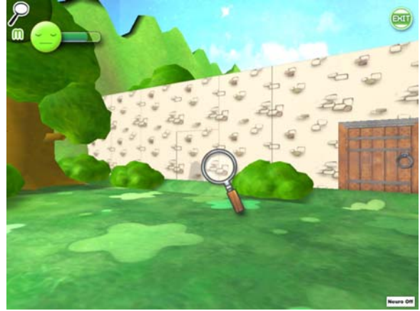
그림 5 탐색 중인 화면. 보이지 않던 쥐구멍이 나타난다.

게임은 시나리오 기반의 싱글 게임과 4 가지의 간단한 게임으로 구성된 미니 게임으로 구성된다. 게임의 대략적인 흐름은 아래 그림 6 과 같다.