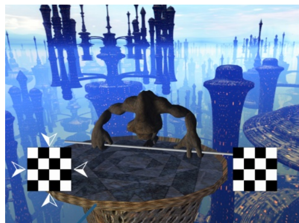
그림 1 "Mind Balance" 게임 화면. 하단에 서로 다른 주파수의 체크보드가 있다.

시간 간격에 따라 서로 바뀌는 체크보드를 준비하여 일반 상황에서 두 종류의 간격에 따라 발생하는 신호를 각각 먼저 측정하였다. 그 다음 실험을 위해 자체 개발한 게임을 하는데, 그림 1 에서와 같이 화면 내에 일반 상황과 같은 시간 간격으로 변하는 체크보드가 있다. SSVEP 의 특징에 따라 피실험자가 체크보드를 바라볼 때 발생하는 뇌파 신호를 분석하면 현재 어느 방향을 바라 보고 있는지를 파악할 수 있으며, 피실험자가 바라보고 있는 쪽으로 캐릭터의 몸이 실시간으로 기울어지게 하였다.