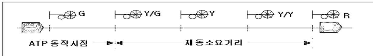
그림 1. 5현시 자동폐색신호 구간의 속도 Pattern

폐색거리분할은 선로의 상태(구배 및 곡선반경 등)와 신호현시조건(3현시 또는 5현시)에 따라서 열차의 제동제어거리를 기준으로 산출하게 되며 5현시 여객열차의 조건하에서에서는 아래와 같다.