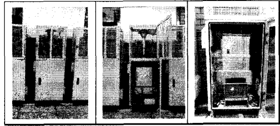
<그림 4> 미세먼지 측정기 설치 사례

지하역사에 실내공기질 감시를 위한 계측장비를 설치할 때 미세먼지 측정기의 경우 지하철 이용자들의 불편함을 최소화하고 장비의 안정적인 설치를 위해 별도로 제작된 하우징을 사용하여 광산란법, 중량법, \beta -Ray 흡수법의 측정원리를 갖는 여러 종류의 미세먼지 측정기를 설치하도록 하였다.