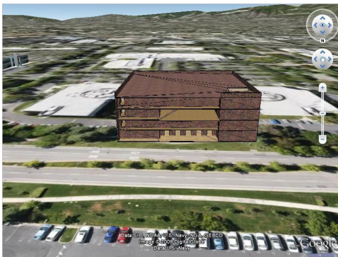
그림 1 KML로 표현된 건물 및 실내

구현 방법으로는 Collada라는 3차원 모델 개발 도구를 이용하여 실내 구조가 있는 건물을 모델링 하여 KML형식으로 바꾸었고 이것을 Google Earth API를 통해 구글 어스(Google Earth)상에 표현을 하였다.