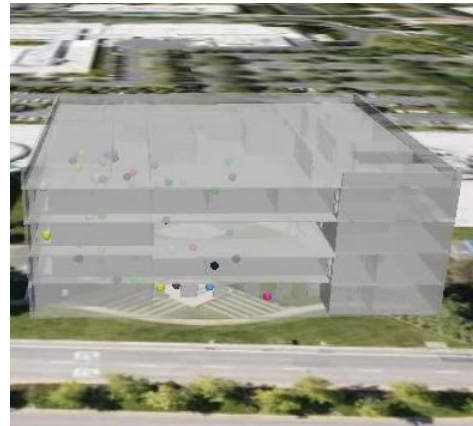
그림 2 실내이동 객체를 가진 건물

DBMS(DataBase Management System)에 실시간으로 갱신이 일어나는 이동 객체들의 정보를 AJAX기반으로 웹브라우저의 페이지 새로 고침 없이 비동기적으로 일정 주기를 통해 정보를 얻게 하였다. 또한 SliverLight 2.0을 통해서 건물 내부의 이미지를 웹브라우저를 통해 방향을 선택 하여 이동 할 수 있게 하여 실내공간을 가상화(Virtualization)시켜 줄 수 있다.