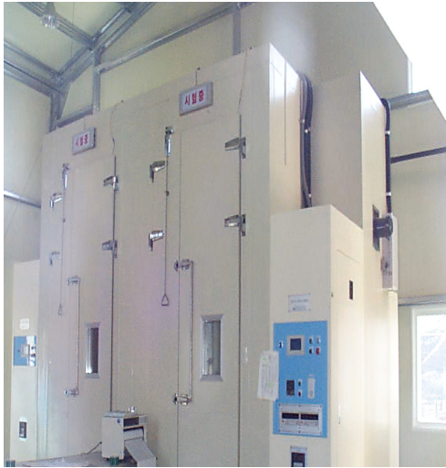
그림 4. 열관류율 측정기기