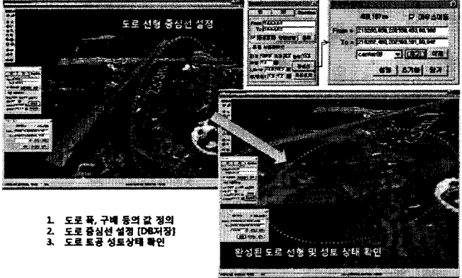
그림 3. 중심선 설정 의한 도로의 토공 상태 확인

본 장에서는 시물레이션 기능 방법론을 기반으로 도로 설계 지원을 위한 4D CAD기능을 구축하여 활용 화면을 구현하고 있다. 그림 3은 도로 선형 및 성토 상태의 확인을 위한 시물레이션 기능을 화면으로 나타낸 것이다. 4D CAD 시스템에서 지형 내에 해당 토공의 선형 중심선을 지정하면 빨간색 선과 함께 선택 지점의 거리가 표시된다. 그리고 각 선택된 지점의 좌표값이 표시되며, 이를 DB에 저장한다. 저장된 도로 중심선 DB 코드를 지정한 후 토공 성토 기능을 선택한다. 즉 DB에 저장된 중심선의 좌표값에 따라 자동적으로 생성된 토공 3D모델을 확인할 수 있다. 이러한 과정을 통해 도로 선형의 확인 및 성토 상태의 시각적 확인이 가능하다. 또한 설계자가 지형 및 인근 마을의 인접도를 고려하여 타당성 있는 노선 계획을 수립할 수 있다.