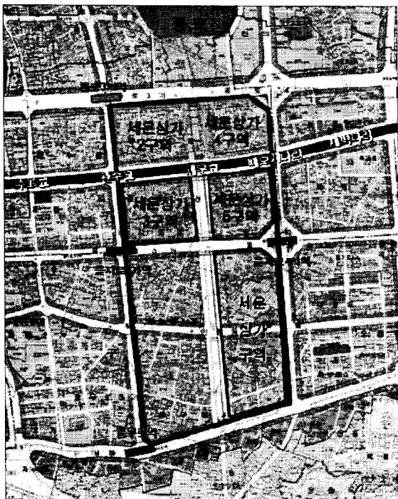
그림 3 세운재정비촉진지구

사업의 예와 같이 몇 개의 구역으로 나누어 단계적으로 사업이 추진되고 있다. 이 구역은 도시의 기능과 사업의 목적에 따라 재정비촉진사업의 4가지 유형(주택재개발사업, 주택재건축사업, 도시환경정비사업, 주거환경개선사업) 중 어떤 형태로 지정되어 추진된다.