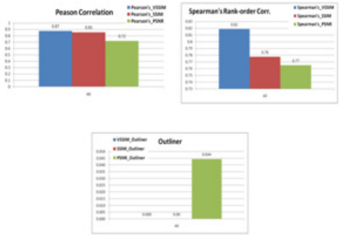
3. 주관적 화질 평가 결과

이 그래프에서 볼 수 있듯이 단순한 상관도만을 비교하는 pearson correlation의 경우 기존의 SSIM과 비교해 봤을 때 약간의 성능 개선이 있음을 알 수 있다. 하지만 monotonicity 혹은 consistency 를 측정하는 spearman's rank-order correlation의 경우 높은 성능 개선을 얻었다.