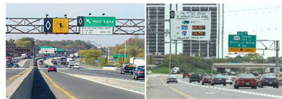
<그림 2> 국외 HOV/HOT Lane 운영현황

HOV/HOT Lane 사례는 미국 New York의 HOV Lane, Minnesota I-394 MnPASS, 휴스턴의 Katy, Northwest Freeway HOT Lanes, 영국 Leeds A647, Stanningley Road System 등 많은 지역에서 시행되고 있다.