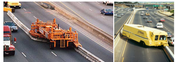
<그림 1> 국외 Zipper Lane 운영현황

Drummoyne, New York의 Tappansee Bridge 등에서 시행하고 있다.