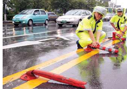
〈그림 1〉 시선유도봉의 설치 및 파손 예시