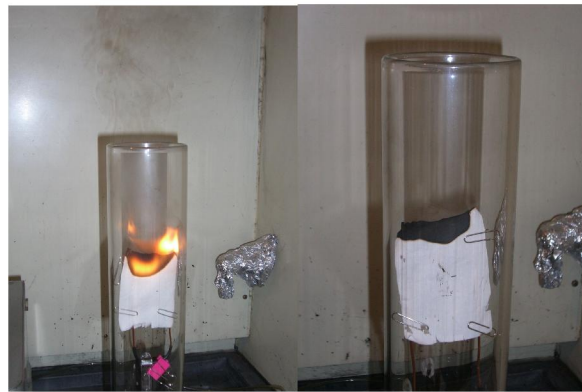
Fig. 2. LOI test of UV-treated Cotton fabrics: (a)untreated (b)110%Add-on.