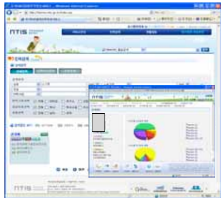
▶▶ 그림 7. 상세검색