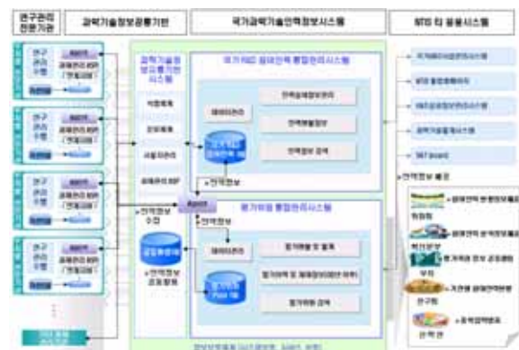
▶▶ 그림 1. 시스템 개념도