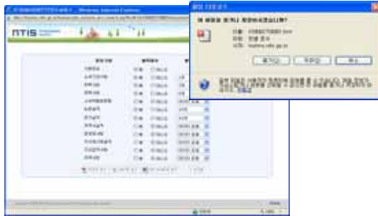
▶▶ 그림 9. 이력서출력