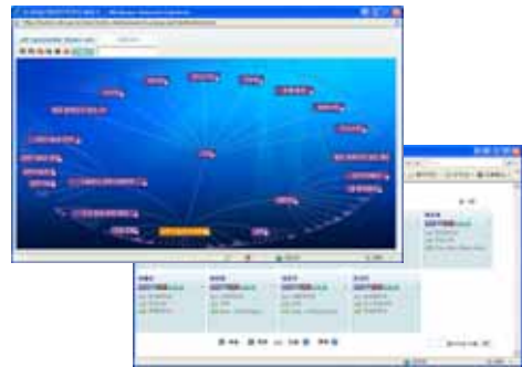
▶▶ 그림 6. 분류검색