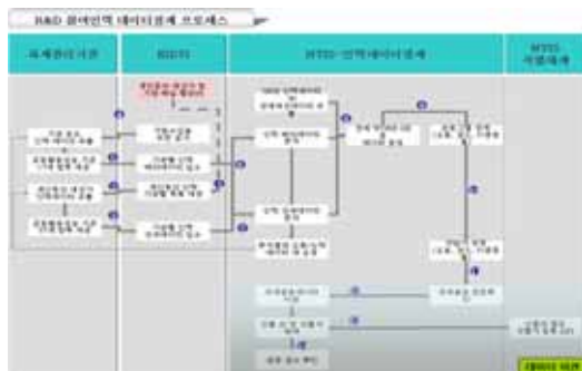
▶▶ 그림 2. 데이터 정제업무 프로세스

국가R&D참여인력 정보는 과학기술관계장관회의(26회, 2007.08.02)에서 확정된 국가R&D참여인력정보 관련 57개 항목(속성)을 관리하고 있다. 현재 12개 기관의 데이터를 Bulk (Off-Line) 또는 정보연계(On-Line) 형태로 수집하여, NTIS 인력데이터 정제 지침 및 매뉴얼에 따라 프로그램에 의한 기계작업과 정제 작업자에 의한 수작업으로 데이터 정제를 수행하였다.