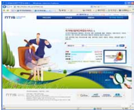
▶▶ 그림 4. 국가R&D참여인력정보서비스

국가 R&D참여인력 서비스의 종합적인 안내를 볼 수 있는 서비스 안내기능과 인력정보에 대한 검색을 수행하는 인력검색, 과제참여인력의 종합적인 현황을 볼 수 있는 현황정보, 등록된 인력정보에 대한 수정을 수행하는 인력정보수정 등을 포함하고 있다.