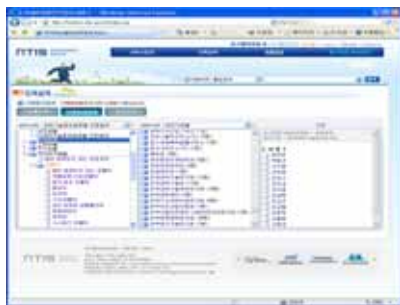
▶▶ 그림 5. 디렉토리 검색