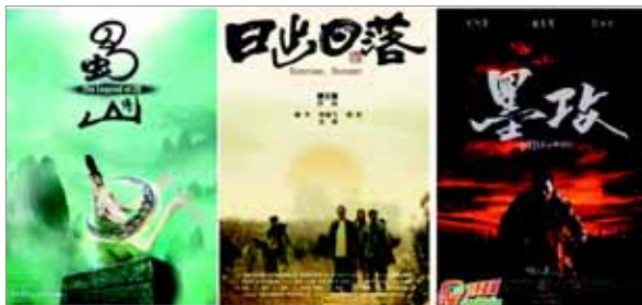
▶▶ 그림 5. 영화포스터

영화포스터는 영화 상영을 알려 극장입장율을 높이는데 그 목적이 있다. 영화포스터 중에서 수묵서법 글자체를 사용하면 시각적 전달이 강하고 사람들이 기억하기 쉽다. 주로 제목의 글꼴을 새로 만들어 사용하는데 발묵법과 선염법을 많이 사용된다.