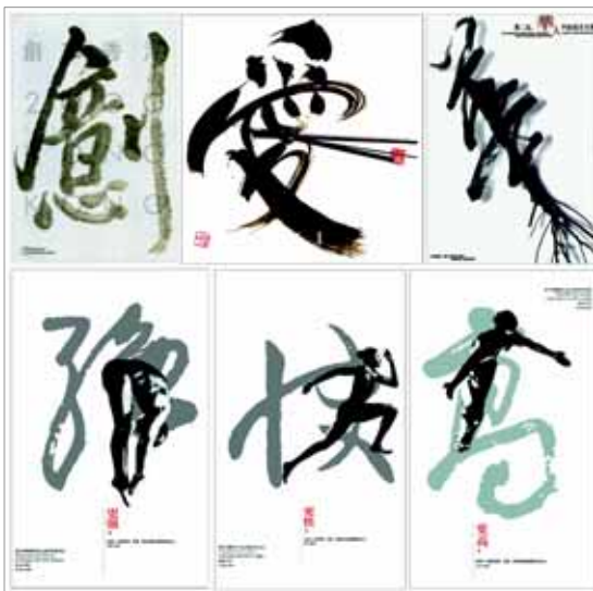
▶▶ 그림 8. 수묵 캘리그래피를 위주로 한 포스터

서예를 포스터에 사용하는 것은 한자단어의 의미를 이용하면서도 시각적인 면에서 작가가 자유롭게 변형이 가능하여 감정적인 면을 시각적으로 전달하기에 적절한 표현이기 때문이다. 이러한 수묵 캘리그래피는 일반적으로 발묵법의 묘법이 사용된다.