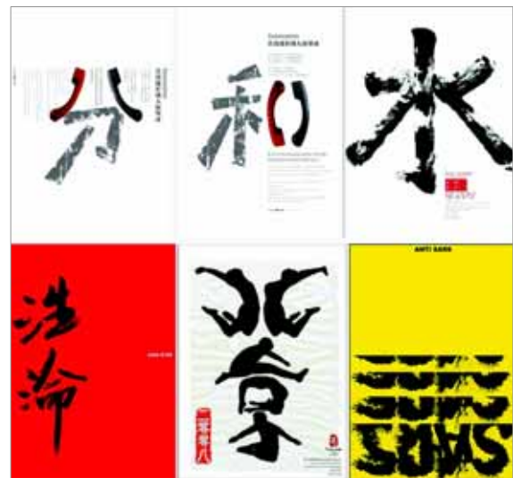
▶▶ 그림 3. 공익포스터

공익포스터는 공공의 도덕과 사회 이슈에 대한 관심과 참여를 대중에게 호소하고, 사회 공공이념을 수립하고자 하는 데 그 목적이 있는데, 비교적 미적 표현이 풍부한 표현보다는 이해가 빠른 표현법을 위주로 사용하기 위해 파묵법이나, 선염법의 묘법이 주로 사용된다.