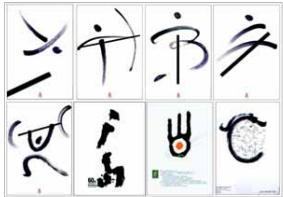
▶▶ 그림 9. 수묵필치를 위주로 한 포스터1

수묵필치를 주제로 한 포스터는 단순한 소재를 가지고 깊이 있는 내용을 표현gknp 된다. 북경 올림픽의 픽토그램이 이러한 수묵 필치를 이용하여 만들어진 것 중에 하나이다. 수묵필치는 제작방법에 있어서 가장 간단하기도 하나 우연성에 크게 영향을 받기 때문에 많은 시간의 반복 작업을 통해 좋은 작품을 얻을 수 있다. 이때 주로 사용하는 묘법은 발묵법과 적묵법이다.