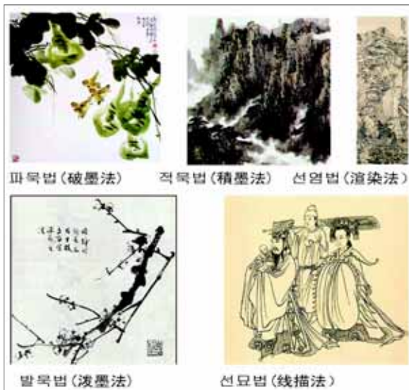
▶▶ 그림 2. 수묵화 표현 기법 그림

수묵화의 기법은 파묵법(破墨法), 적묵법(積墨法), 선염법(渲染法), 발묵법(潑墨法), 선묘법(線描法)으로 나뉜다.