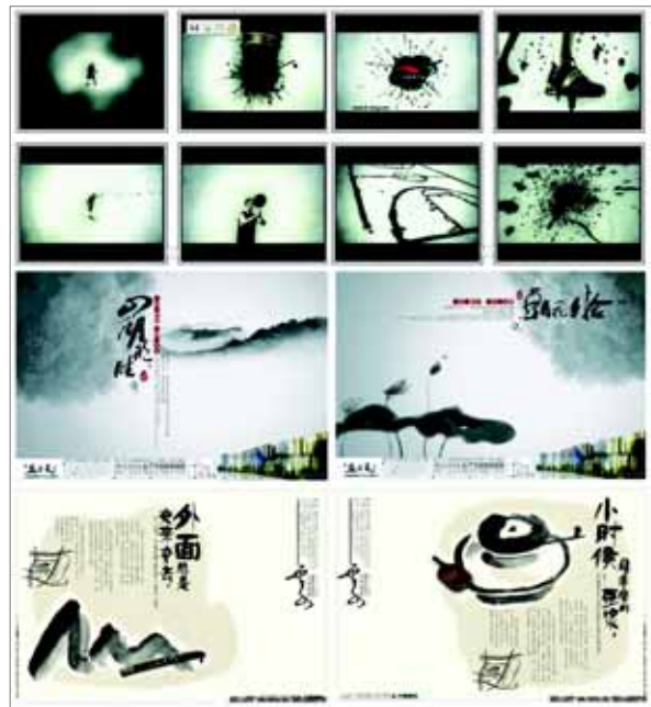
▶▶ 그림 6. 상업 포스터

상업포스터는 소비자로 하여금 구매의욕을 일으키게 함과 동시에 판매활동의 촉진하는 역할을 하는데 최근에는 기업의 신뢰도를 높이는 기업이미지 광고를 많이 제작한다. 판매촉진을 위한 강한 메시지를 완화하는데 수묵표현법을 많이 사용하여 서정적인 분위기가 되도록 유도하기도 한다.