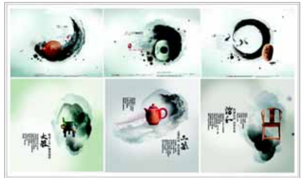
▶▶ 그림 10. 수묵필치를 위주로 한 포스터

포스터에서 자유로운 수묵필치를 배경소재로 하는 표현법으로 붓과 먹을 사용하여 글자도 아니고, 오브젝트그림도 아닌 그냥 단순한 흔적을 남기는 시각표현법으로 과묵법과 선염법이 주로 사용한다. 주제 이미지를 부각시키면서 주제 이미지와 함께 동화되어 가기 때문에 수묵 흔적이라고 부를 수 있는데, 한적하고 단정한 중국 전통의 풍류를 나타내기에 적합하다. 먹의 농담에서 느껴지는 블랙과 화이트 사이의 풍부한 그레이톤은 동양예술의 깊이를 느끼게 한다.