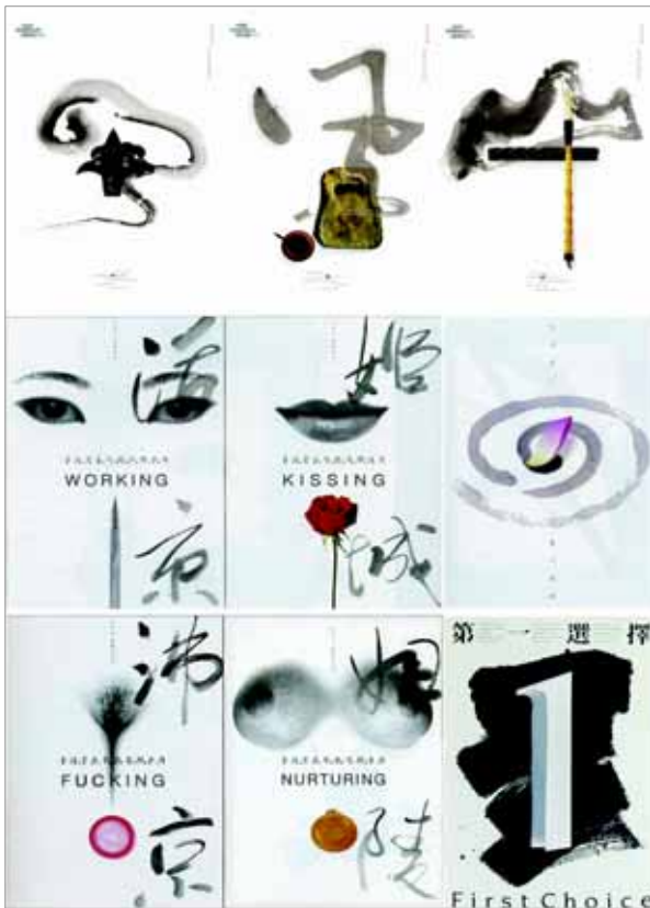
▶▶ 그림 4. 문화행사 포스터