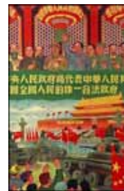
▶▶ 그림 2-1. 1949년 중화인민공화국건립 경축행사를 위해 제작된 포스터

당시 세계적 맥락을 보면 혁명과 사회변혁의 시대이며 포스터 [그림 2-1]에 나타난 Red Color는 혁명의 상징이고, 더욱이 중국인에게 있어서는 한 세기 동안의 혁명과 투쟁으로 민족의 독립과 존엄을 지켜낼 수 있게 한 공산주의(共產主義)와 그 사상에 대한 긍지와 자부심을 대표하는 Color로 인식되어왔다.