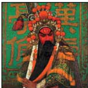
▶▶ 그림 1-3. 관운장(關雲長). 중국전통 경극(京劇)에 붉은 낫을 강조하는 분장으로 나타나며 정직함과 의리를 대표하는 인물이다.

스위스 심리학자 융(Carl Gustav Jung, 1875.7.26~1961.6.6)에 의하면 인간의 인격(人格)전체를 정신(精神)이라고 부르며, 정신은 의식적(意識的)인 사고, 감정, 행동뿐만 아니라 무의식적인 것까지 포함한다. 3) 그리고 의식과 무의식은 집단 무의식을 기반(基盤)으로 하며, 4) 집단무의식은 원시적 이미지라 불리는 잠재적(潛在的) 이미지의 저장소이다. 인간은 원시적인 이미지를 조상 대대로 물려받고 있으며, 인류 이전의 조상까지도 포함한다. 5) 이런 이유로 5000년의 변천을 거쳐서도 Red Color에 대한 애착심은 변함이 없이 중국문화에서 대대로 전해 내려왔다.