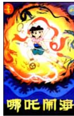
▶▶ 그림 2-4. 1988년 제7기 프랑수아볼라스트문화구락부 청년국제 애니메이션 영화제 수상한 애니메이션 포스터

이런 세계적 맥락의 영향으로 1980년부터 만들어진 포스터 [그림2-4] 에서는 Red Color 위주의 경향으로부터 다채로운 Color를 조합함으로써 생기와 즐거움을 불러일으키고 있다. 혁명과 공산주의를 상징하던 Red Color가 중국전통문화가 예로부터 지니고 있던 양상들을 되찾게 된 것은 개혁개방후의 중국 사회문화와 사회의식의변화를 말해주며 세계 각 국가와의교류를 원활하게 진행하기 위한 정책의 변화와 중국문화 자체가 국제화를 추구하기 시작한 결과라고 볼 수 있다.