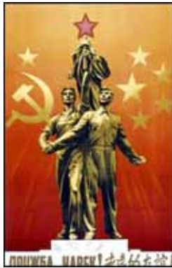
▶▶ 그림 2-2. 중화인민공화국 건립초기 제작된 포스터

1966년부터 1976년 사이에 제작된 포스터 [그림2-3] 에는 큰 면적에 Red Color를 사용함으로써 극단적인 혁명과 공산주의를 표현하고 있다는 것을 분석해낼 수 있다.