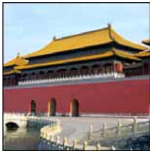
▶▶ 그림 1-1. 중국청조황궁-자금성

중국인들은 Red Color를 선호한다. 음양오행사상의 영향으로 Red Color는 양(陽)의 상징이고 밝음을 의미하며 오행가운데서의 불(火)을 뜻한다. 또한 [그림 1-1] Red Color는 고귀함, 흥성, 길함(吉)의 표현이고 [그림 1-2] 순결함, 행복, 경사로움의 표현이며 [그림 1-3] 정직함과 의리를 대표하는 인물이다. 중화민족이 Red Color를 숭상하는 전통과 심리는 민족의 문화 역사적 근거가 있는 것이다.