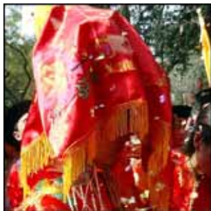
▶▶ 그림 1-2. 중국전통 혼례식 신부의 단장