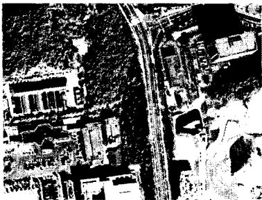
그림 3. 인공지물을 추출한 지역

단일 고해상도 위성영상에서 추출한 3차원 인공지물 정보는 인공지물의 높이와 인공지물의 Footprint 좌표(영상 좌표)로 이루어져 있다. 본 연구에서는 기존 수치지도로부터 수치표고자료를 생성하고, 이를 이용하여 생성한 지형 위에 단일 고해상도 위성영상으로부터 추출한 인공지물 모델을 올렸다. 본 연구에서는 지상기준점을 이용하여 위성영상에 대한 센서모델을 수립하고, 추출된 인공지물 Footprint의 정확한 지표면 좌표를 알기 위해서 RayTracing 방법을 적용하였다.