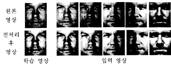
<그림 1> Yale Face Database B와 전처리 과정 후 영상[8]