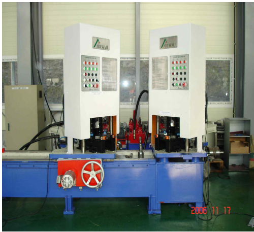
그림 4. 벤딩 다이시스템의 설치도