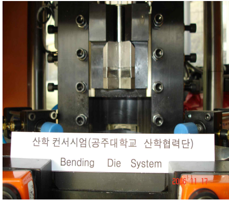
그림 3. 벤딩 다이 상단 금형부