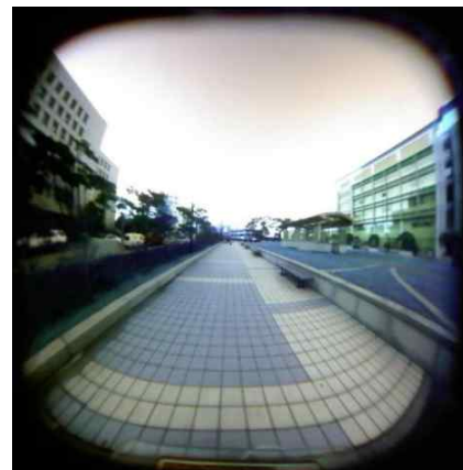
그림 5. 제안한 방법에 의한 변환.