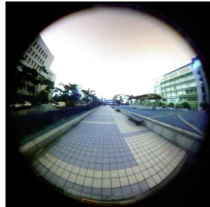
그림 3. 어안 영상.