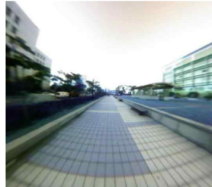
그림 4. [1]의 방법에 의한 변환.