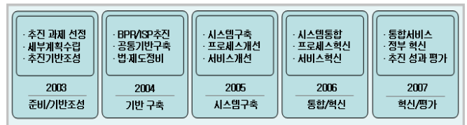
(그림 1) 전자정부 연도별 추진 계획

전자정부(e-Government)란 '정보기술을 활용하여 행정기관의 사무를 전자화함으로써 행정기관 상호간 또는 국민에 대한 행정업무를 효율적으로 수행하는 정부(전자정부법 제2조 제1항)'를 말한다[1]. 우리나라는 1987년 주민, 부동산, 자동차 등 국가기간전산망사업을 시작으로 전자정부를 추진해 왔고 2003년 8월 참여정부가 추진해야 할 4대 추진 방향에 대한 10개 아젠다, 31개 우선 추진 과제를 포함하는 전자정부 로드맵을 제시하였다. 전자정부 로드맵은 (그림 1) 과 같이 2003년부터 2007년까지의 연도별 계획에 따라 단계적으로 추진되고 있다[2].