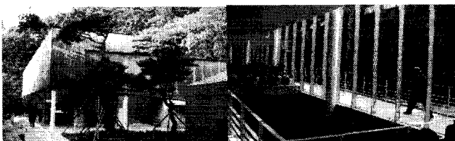
<그림 5> 의재 미술관 외부