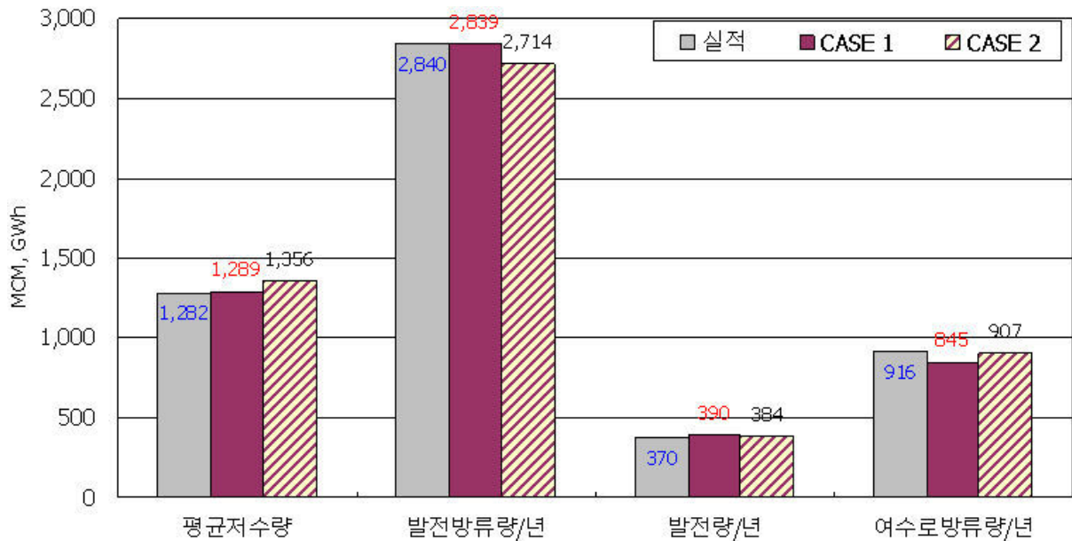
그림 2. 각 Case 별 실시간 모의 운영 결과

금강수계의 용담과 대청 다목적댐에 대하여 2003년 1월 ~ 2007년 12월까지 1년 단위로 나누어 실시간 모의 운영을 수행하였다. 초기저수량은 용담, 대청댐 과거 운영실적의 저수량으로 설정하였으며, 월말 목표 저수량과 유입량은 각 Case별로 표 1의 운영조건을 따랐다. 각 수요지의 용수수요량은 2003년 기준 수요량을 적용하여 CoMOM을 수행하였다. CoMOM결과를 따라 실시한 방류량의 하천 방류 효과와 다음날의 새로운 방류량을 산정하여 방류하기까지 발생하는 실제유입량과 예측유입량과의 차이를 보정한 다음날의 실제 가능한 초기 수위를 도출하기 위하여 유역 물배분 모의 모형인 KModSim 모형을 사용하였다. 유역 물배분 모의 모형은 시스템 제약을 확인하여 CoMOM에서 제시한 방류계획을 그대로 수행 하였을 때 얻게 되는 기말 저수량을 도출해준다. 이렇게 도출된 기말 저수량은 다음날 초기 저수량으로 CoMOM에 입력되어 모의운영이 반복된다. 이와 같은 실험을 각 Case별로 진행하였으며, 그 결과는 그림 2 및 표 2와 같다.