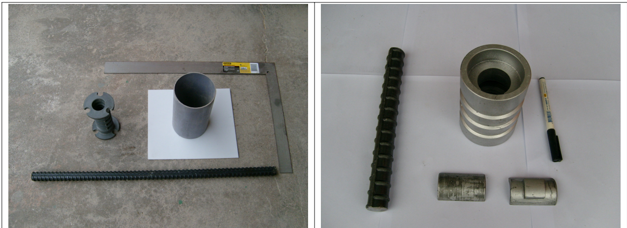
그림 2. 1 제거식 쏘일네일 구성부품 - 플라스틱 소켓(좌), 스틸소켓(우)

기준에 사용되고 있는 제거식 쏘일네일은 강봉과 플라스틱으로 제작된 고정자소켓으로 구성되며 구성 부품은 그림 2. 1(좌)와 같다. 실내시험을 수행하기 위해 개발된 스틸 고정자소켓이 장착된 네일은 그림 2. 1(우)와 같으며 이형철근과 스틸소켓, 스틸커플러로 구성된다. 소켓내부에 키홈이 형성되어 있고 스틸커플러의 키와 결합하여 하중을 저항하게 된다. 또한 제거는 이형철근을 360° 돌리면 수평키홈에서 수직키홈을 따라 제거되는 원리로 이루어진다.