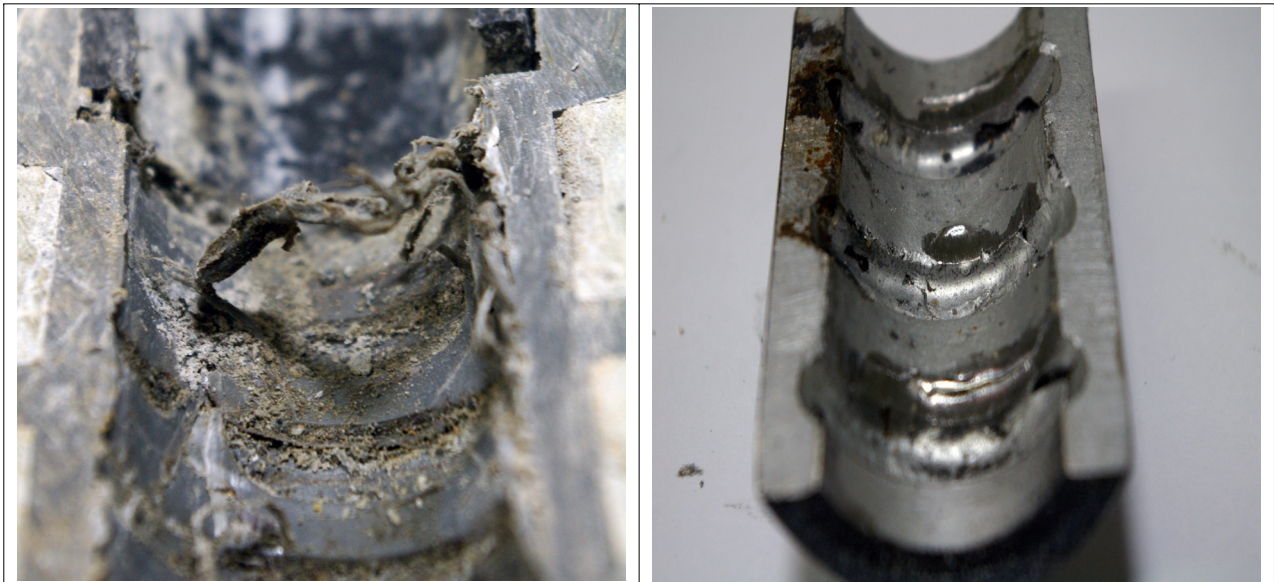
그림 2. 2 인발 시험후 소켓내부도 - 플라스틱 소켓(좌), 스틸소켓(우)

실내인발시험을 실시한 후 플라스틱 소켓과 스틸 소켓의 항복 메커니즘을 확인하기 위해 플라스틱 소켓은 강봉 제거 후 소켓을 반으로 잘라서 내부를 관찰하였고 스틸 소켓은 강봉을 제거하여 소켓과 커플러를 해체한 후 내부 모습을 관찰하였다. 그 결과 아래의 그림과 같이 소켓 내부의 마모 및 변형으로 인해 네일의 항복이 발생한 것을 확인할 수가 있으며 플라스틱 소켓의 경우 돌출부분이 확연하게 파괴되는 것을 관찰할 수가 있으나 스틸소켓의 경우는 부분적으로 일그러진 모습을 확인할 수가 있었다.