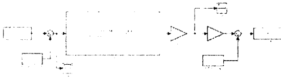
Fig. 2. Simulink Model for PPF Control

정도로 감소됨을 알 수 있다. 이를 통해 피드백 제어기를 이용해 강제 진동 응답을 감소시킬 수 있음을 확인할 수 있었다.