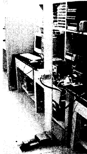
Fig. 1. Experimental Setup for Forced Vibration Suppression

차량이 운행중일 경우 엔진의 진동이 지속적으로 프레임으로 전달되기 때문에 지속적인 외부 교란이 있을 경우에 진동 응답을 효과적으로 억제할 수 있는지에 대한 검증이 필요하다. 이론 모델을 바탕으로 수치계산을 수행하여 PPF 제어기가 지속적인 외부 가진력에 대해 효과적임이 입증되었다. 이론 결과를 바탕으로 Fig.1 과 같은 실험 장치를 구성하고 능동진동제어 실험을 수행하였다. 먼저 외팔보에 가진기를 부착하고 이를 함수발생기를 이용해 30Hz 사인파로 가진하였다. 그 다음 PPF 제어기를 이용해 강제 진동 응답을 억제할 수 있는지의 여부에 대해 실험을 수행하였다.