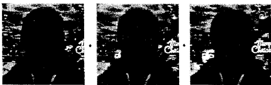
(b) 기존의 매팅 방법