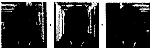
(a) 원 영상

다시점 실사 디지털매팅을 구현하기 위해 Multi Sync IEEE-1394b Camera System을 사용했다. 기준 시점의 전경뿐만 아니라 모든 시점의 전경을 뽑아내어 그것을 임의의 다시점 배경위에 올려놓아 다시점 실사 디지털 매팅을 구현했다. 기존 방법들은 배경을 고려하지 않고 전경 분리에만 초점을 맞췄지만, 제안하는 방법은 배경과의 조화에 초점을 맞췄다. 그림 3은 7개의 전경 시점과 배경시점을 합성하여 만든 다시점 실사 디지털 매팅 결과이다. 기존의 방법은 가운데 영상의 전경만을 추출할 수 있는 방법이지만, 제안하는 방법은 모든 다시점 전경을 추출할 수 있는 방법이다. 이로써 전경 객체의 시차와 배경의 시차가 적절히 조화된 합성영상을 만들었다.