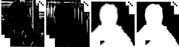
(a) 다시점영상 (b) 분산영상 (c) 트라이맵 (d) 알파맷 그림 2. 다시점 실사 디지털 매팅 과정

파맷을 만들어 전경 객체를 분리한다. 반복적으로 기준시점을 바꾸어가며 각 시점에 대한 알파맷을 계산하여 전경을 추출한다. 본 논문은 기준 영상에 가중치를 주어 각 시점의 전경을 효과적으로 분리했으며, 최종적으로 추출된 각 시점의 전경 객체를 시차가 있는 배경위에 병합해 다시점 실사 디지털 매팅을 완성했다.