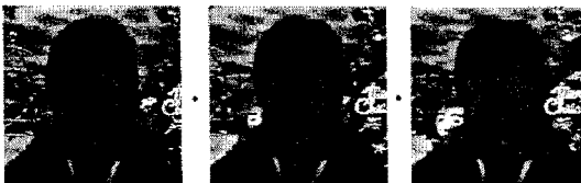
(c) 제안된 방법