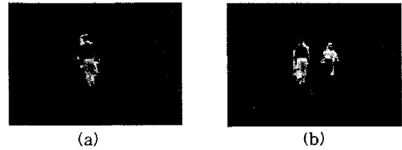
그림 2. "Hall_monitor"영상의 움직이는 객체 분할: (a) 68번째 프레임 (b) 152번째 프레임