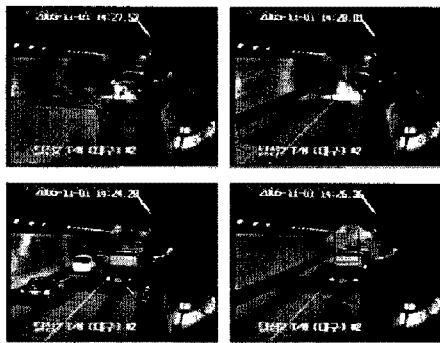
그림 1. 화염 및 연기 검출 알고리즘 결과

본 논문에서 제안한 알고리즘을 구현하고 실제 터널 내 화재 영상을 입력으로 받아 실험하였으며 객관적인 분석을 통하여 검증하였다.