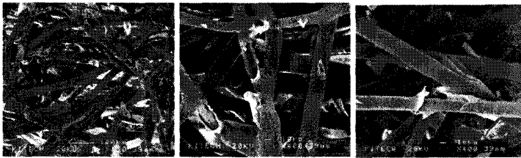
Fig. 2. The adhesion(delamination) between layers after immersion in Toluene/Xylene solution.