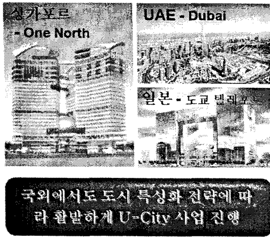
그림 3 국외 U-city 사례