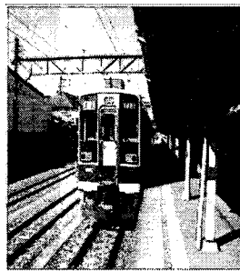
Fig. 3. 전철 역 : 전선이 철로 위에 놓여 있다.

또 다른 예를 보자. 다음은 전철역에서 발생하는 전기감전 문제를 해결하기 위하여 모순을 사용한 예이다. Fig. 3은 전철역의 사진이다. 사진에는 공중에 높은 전압의 전선이 설치되어 있다. 주기적으로 전철역은 청소를 한다. 물을 뿌려 청소를 하는 경우 호스에서 흘러나온 물이 전선에 닿을 수 있다. 아주 위험하다. 이 문제를 트리즈의 모순을 적용하여 해결해보자.