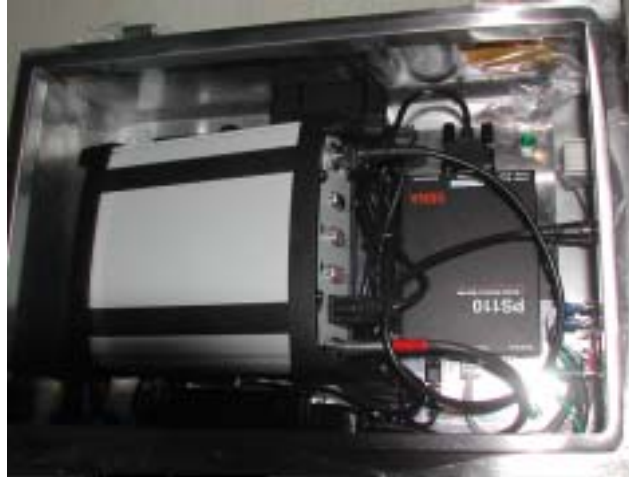
그림 3. GPS 수신기