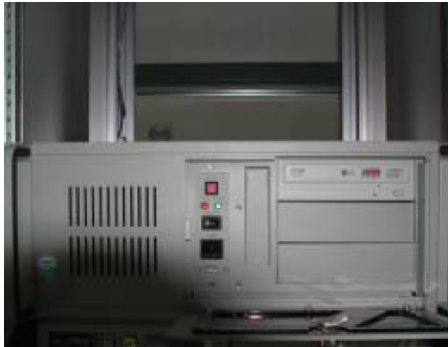
그림 4. GPS 계측 컴퓨터