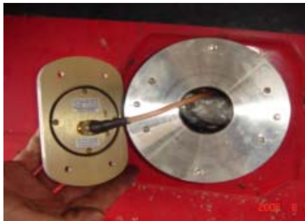
그림 2. GPS 안테나

그림 4는 GPS 계측 컴퓨터를 보여주고 있는데, 기존 계측시스템과 HUB를 이용하여 연결되어 측정 Data를 동기화하며, Hub에 연결된 LAN 변환기의 GPS Data를 분석하고 저장하는 기능을 담당한다.