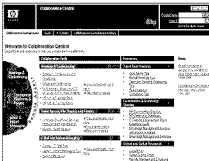
그림 1. HP사의 @hp 업무포털에 탑재된 협업부화면. 연구개발기관은 보안상의 이유로 유관 기관과의 협업과 모바일포털 구현에는 한계가 있다. 그러나 협업과 시공간의 제약이 없는 포털에 대한 요구가 증대하고 있어 해결책 마련이 시급하다.

인편으로 기업의 비즈니스는 시장변화에 따라 판매품과 소매품을 반복하기 때문에 기업의 업무는 상대적으로 변화가 심하다. 그래서 정해진 업무를 수행하는 정부기관의 포털에 적합한 정적인 업무참조모델을 기업 포털에 적용하는 것은 적합하지 않아 보인다.