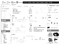
그림 5. 맞춤형 업무포털의 메인화면 예시. 연구개발 기관의 지식근로자를 위한 포털 서비스들을 탑재하였다.

그림 5의 상단에 있는 "나의 업무 목록"은 나에게 배당된 업무목록이다. 과속하단의 "일상 업무명"은 행정업무 분류목록으로서 업무별 처리 프로세스는 EPM에 의해 자동 수행된다. 예컨대 휴가신청을 하면 승인권자 화면의 "나의 업무목록"에 휴가신청권이 배당된다. 휴가신청을 지원하는 지식은 EPM에 연동되어 제공되며 휴가규정, 신청서식 작성방법, 작성사례 등이 제공될 수 있다.