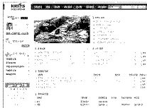
그림 3. 한국표준과학연구원 업무포털 화면 예.

그림 3에서 “나의 업무”와 “진행중인 업무”는 업무 프로세스 표준화와 EPM 탑재에 의해 자동화/간편화된 일상적인 행정업무를 보여주고 있으며, 전자화된 규정/절차집을 제공하여 지식관리 서비스도 함께 제공하고 있다. 그림 3의 하단에 있는 “참여과제 일정”은 연구개발과제 업무를 지원하는 서비스인데, 과제일정 관리만을 단순지원할 뿐 정작 중요한 연구개발 프로세스와 전문지식 관리 서비스가 제공되지 않는 아쉬움을 남겼다.