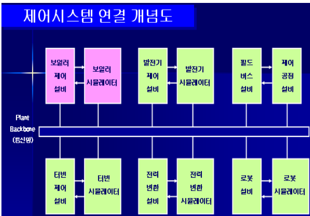
<그림 3> 제어시스템 연결 개념도

제어시스템을 검증하기 위한 시뮬레이터는 각 제어시스템에 단독으로 시험 할 수도 있으며 네트워크에 연결되어 통합 검증을 할 수 도 있게 그림 3과 같이 구성 되어진다.