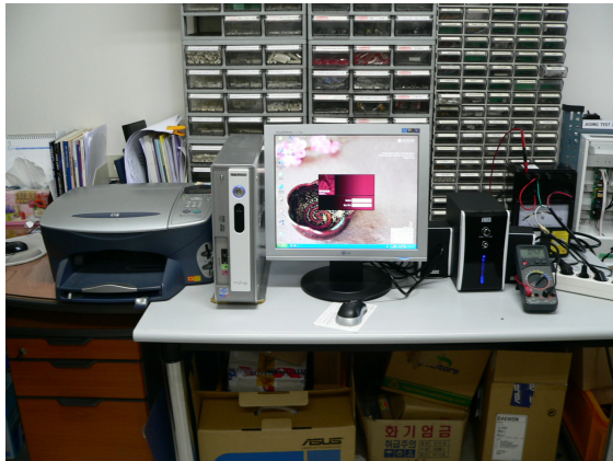
<사진 1> 시험대상품 멀티 콘센트에 연결 상태