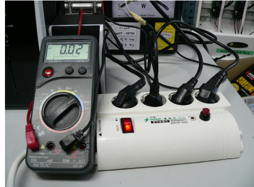
<사진 3> 자동절전제어장치의 멀티콘센트에서 컨트롤 제어부 작동시 소비전류

나. 같은 시험방법으로 자동절전제어장치의 멀티콘센트에 연결하여 컨트롤 제어 부분이 동작시 대기전력시험 측정결과는 <표 2>와 같다.