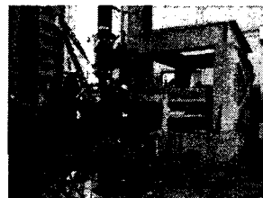
그림 2. 탄성받침 전단피로실험

허용전단변형률과 허용압축응력에 관한 시험에서 1단계는 KS F 4420에서 제안하는 허용전단변형률과 허용압축응력의 타당성을 검증하는 것이다. 따라서 허용전단변형률 시험에 있어서는 전단변형률이 70%인 상태에서 20,000회를 수행 후 1단계 시험의 결과에 따라 2단계 시험에서 전단변형률을 20%