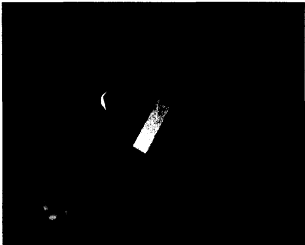
(A) BOTTOM EMISSION TYPE OLED 구동후