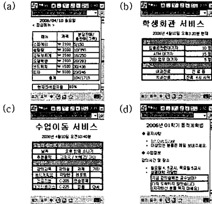
그림 3. 경로패턴에 따른 개별화된 서비스

이와 같은 방법으로 사용자가 이동 중에 유사하다고 판단되는 패턴이 선택되는 즉시 적절한 서비스를 제공한다. 그림 3은 이동경로 패턴에 따라 예측된 사용자의 상태에 적합한 서비스이다.