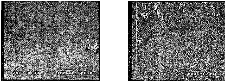
Fig 2. PE film (left) and PE/Sericin plastic (right) SEM photograph.