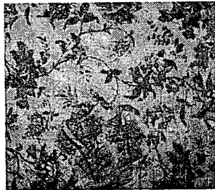
<Ostrich skin에 적용>

특수피혁인 Ostrich skin의 표면에 있는 돌기에 의해 디지털 프린팅이 어려울 것으로 예상했던 것과는 달리 표면과 맞닿지 않고 3~4mm 이상 표면 위에서 잉크가 분사되는 UV 디지털 프린팅 특성으로 표면 돌기에 의한 영향은 거의 없어 표면이 Flat하지 않은 천연가죽에도 적용이 가능한 것을 확인할 수 있었다.