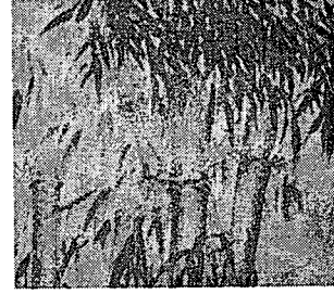
<Shrunken type의 deer skin에 적용>