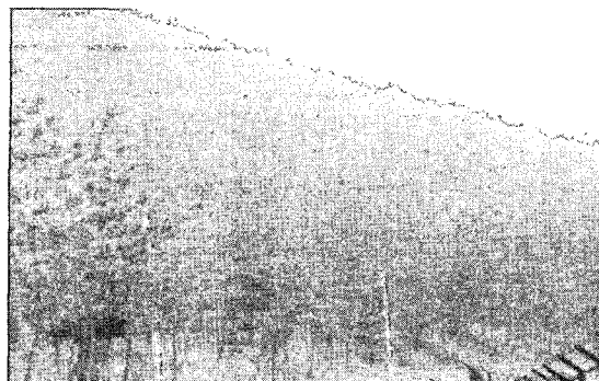
그림 3. II영급의 A지역 현장 사진