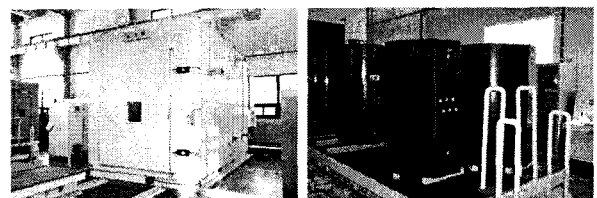
<그림 1> 환경시험장비 가동(냉열충격시험장치)