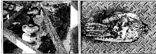
조류집족으로 인한 애자절연 파괴

2.1.4 해외 전력회사 사례 남아프리카 공화국의 전력회사인 ESCOM사의 송전선로 고장분석 자료에 의하면 조류에 의한 고장이 전체고장의 38%를 차지하고 있으며 그 중 대부분은 거대조류의 긴 배설물이 전선과 철탑을 연결하는 도체 역할을 함으로써 심각한 고장이 발생하였다.