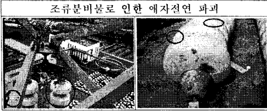
조류분비물로 인한 애자절연 파괴