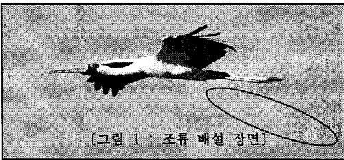
[그림 1 : 조류 배설 장면]

2.1.4 해외 전력회사 사례 남아프리카 공화국의 전력회사인 ESCOM사의 송전선로 고장분석 자료에 의하면 조류에 의한 고장이 전체고장의 38%를 차지하고 있으며 그 중 대부분은 거대조류의 긴 배설물이 전선과 철탑을 연결하는 도체 역할을 함으로써 심각한 고장이 발생하였다.