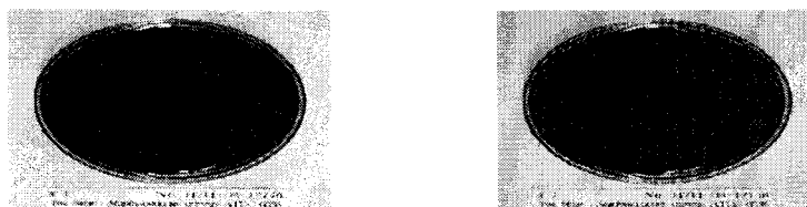
(b) Fabrics treated with 8% conc. of SAUBERSET PS-532K