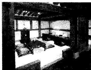
<그림 4> 인터방