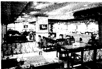
<그림 3> 리운지

실내공간에서 사용된 재료는 바닥과 기둥, 서까래, 보를 재현하기 위해 목재를 주로 사용하였고 기둥과 기초부분에는 화강석을 사용하였다. 또한 전통 한옥의 아궁이를 흙을 사용하여 뒤편공간으로 연출하여 전통 한옥의 주방과 장독대를 체험할 수 있도록 하였다. 색채는 목재의 갈색계열과 회벽의 회백색계열을 함께 사용하여 강한대비를 이루면서 서로 조화를 이루도록 계획하였다. 이에 부분적으로 쇠 장식(5)을 장식적인 요소로 사용하여 재료와 색채의 다양성을 연출하였다. 리셉션 데스크는 자개를 사용하여 양반가에서 느껴지는 권위와 품격을 연출하였고 데스크 후면에 전통 민화를 조명박스에 삽입하여 공간의 다양성과 온화함을 유도하였다.