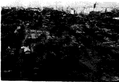
<그림 1> 사합원이 밀집하고 있는 오늘날의 북경 주거지역의 모습

북경 사합원의 건축적 역사의 배경은 삼천 년이 넘는 중국의 주거문화 발전과정에서 오늘날과 같은 형식의 사합원이 정착된 것은 한 대(漢代) 이후라고 알려져 있다. 중국의 주거문화는 신석기 시대 말의 각종 동굴 주택을 시작으로 오랜 기간 발전하였다. 기원전 10세기 전후의 서주시대(西周時代)에 이미 중정형이라는 중국 고유의 주거형식이 정착된 것으로 파악된다. 또한 한대에 이르러서 사합원이 오늘날과 같은 형식을 갖추면서 중국의 전역으로 전파되었다고 생각된다. 이렇게 사합원은 이천 년 이상의 오랜 역사를 갖는 주거형식이라고 할 수 있다. 3) 사합원은 한대 이후 부재(部材)의 조립방식, 벽체의 장식패턴, 채색기법 등 부수적인 요소들의 변화는 조금씩 있었지만, 공간구성의 기본적인 방식은 크게 변화하지 않고 오늘날까지 이어져 내려왔다.