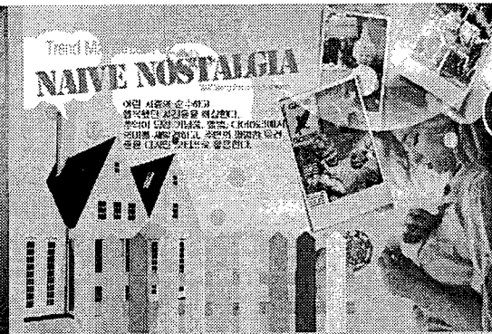
Theme 2. Naive Nostalgia