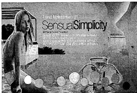
Theme 1. Sensual Simplicity

* Color - 베이지, 브라운 컬러에 그린과 옐로우를 첨가하여 업그레이드된 사파리 컬러를 제안한다. 깊고 진한 레드, 블루, 퍼플로 이국적인 강렬함을 부여한다.