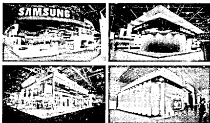
[그림 2] 삼성전자의 전시/홍보관 외관 전경

벗어나 중심에서 구석까지 한 눈에 둘러볼 수 있도록 설계하여 시야를 확보함은 물론, 짧고 단순한 동선으로 방문객이 물러오는 시간대에도 무리 없이 관람할 수 있게 하였다. 전문 안내원의 경우, 체계적으로 배치되어 LCD 모니터나 대형 전광판, 패널 등의 정보 전달 매체를 시선의 흐름에 맞게 효율적으로 배치하여 관람객이 집중하지 않더라도 간접적인 경험