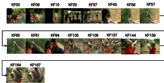
(그림 3) 장면 전환 검출

러스터로부터 가능한 SCFs를 선택한다. 그리고 획득된 SCFs에 따른 샷에 비디오 시퀀스 분할한다.