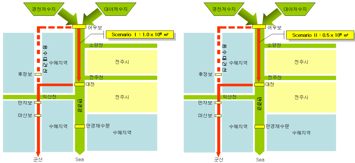
Fig. 4. Rearrangement plan of water supply system at Mankyong River

가하고자 한다. 이때 전주천의 용수는 만경강의 유출량과 합쳐져서 농업용수로 활용하게 된다.