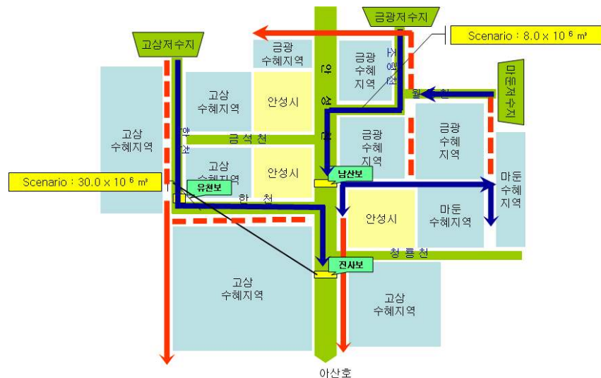
Fig. 3 Rearrangement plan of water supply system at Ansong Chun

검토한 재정비 방안은 Fig. 3와 같이 금광저수지와 마둔저수지에서 총 취수량인 10.33 \times 10^6 \text{ m}^3 에서 상류부 공급량을 제외한 8.0 \times 10^6 \text{ m}^3 을 안성천의 지류인 월동천과 조령천에 유하시키고 도심지구간 이후인 남산보 지점에서 재이용하는 방식이다. 또한, 고삼저수지에서 취수량인 39.5 \times 10^6 \text{ m}^3 중에 30.0 \times 10^6 \text{ m}^3 을 한천으로 유하시키고 하류부 유천보와 안성천 합류후인 진사보 지점에서 나누어 재이용 하는 방식이다.