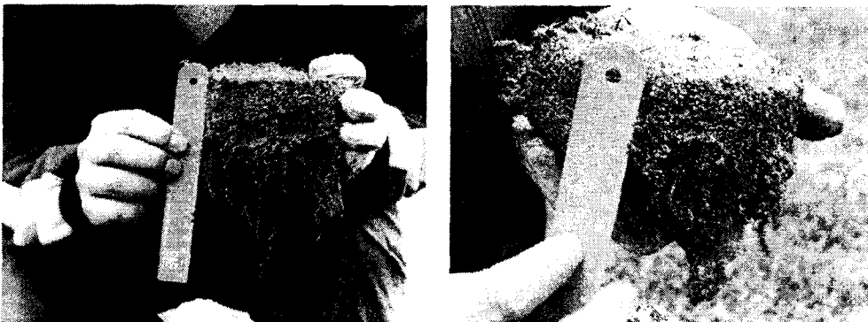
그림 1. 2번 홀과 16번 홀의 잔디 뿌리 길이 비교

총 18홀 그린중 가장 좋은 그린으로는 #2홀 green을 선정하였으며, green에 이상 증상이 있는 지역으로 #1홀, #11홀, 그리고 #16홀을 선정하여 실험을 실시하였다. #1홀 그린에서는 건조증상으로 인해 green 일부 지역의 잔디가 생육이 불량하여 상토층 토양이 그대로 드러났으며, #11홀과 #16홀에서는 조류발생이 많았다. 그린 상태가 좋은 #2홀의 잔디 뿌리 길이는 대체적으로 15~25cm의 왕성한 뿌리 발육을 보였으나 다른 green에서는 대략 4~12cm의 부진한 뿌리 발육을 보였다(그림 1). 잔디 잎의 밀도 또한 #2홀에서는 평균적으로 75~90개/cm 2 였으며, #1홀에서는 건조지역 주변의 잔디 밀도가 25~30개/cm 2 , #11홀과 #16홀은 조류가 있는 지역의 잔디 밀도가 0~50개/cm 2 로 측정되었다(표 1).